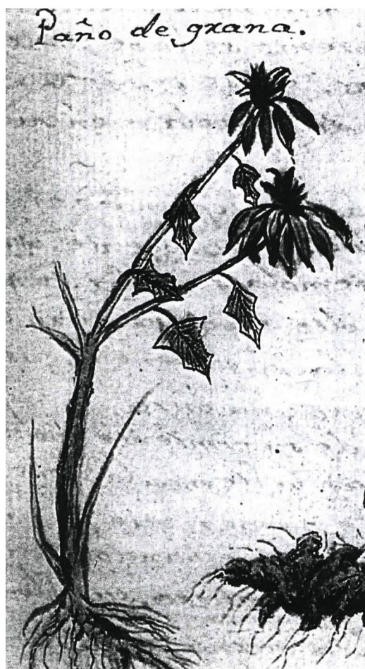
Figura 3. Nochebuena nombrada como «pañó de grana» en Historia Natural o Jardín Americano del año 1801 (Navarro, 1992). Ilustración de Euphorbia pulcherrima con inflorescencias dobles.

H: haplotipo; H_d : diversidad haplotípica; k: promedio de número de diferencias nucleotídicas; S: número de sitios segregantes; SD: desviación estándar; \theta_w : diversidad genética; \pi : diversidad nucleotídica.