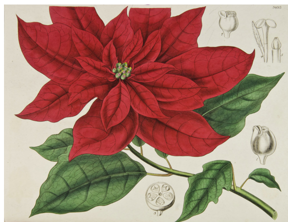
Figura 4. Ilustración botánica de nochebuena descrita como Poinsettia pulcherrima en Graham (1836b).

desde la época prehispánica en lo que es hoy el Distrito Federal (Sahagún, 1979), y la presencia de cultivares mexicanos en la Nueva España se observa en la ilustración de Navarro (1992), en la cual se dibuja una nochebuena con inflorescencias de más de una hilera brácteas (fig. 3). Incluso es posible que Joel Roberts Poinsett se haya llevado plantas con cierto grado de manejo, ya que se observan plantas con inflorescencias dobles en ilustraciones de Graham (1836b) (fig. 4). También es posible que existan variantes novedosas de nochebuenas en el Distrito